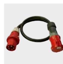
400 volt verlengkabels