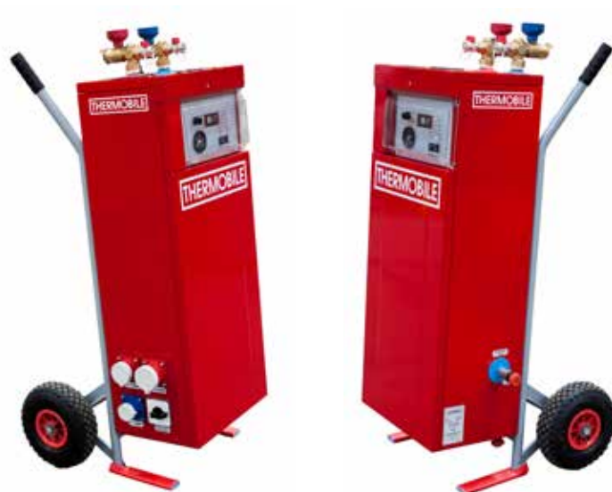
TMB 19/20/40 (F)